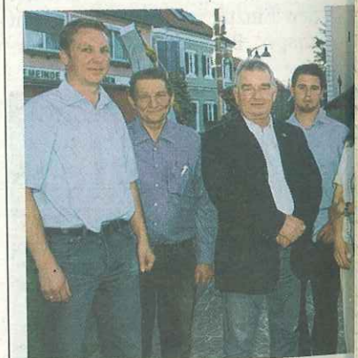
In Mooskirchen fand der erste Parteitag